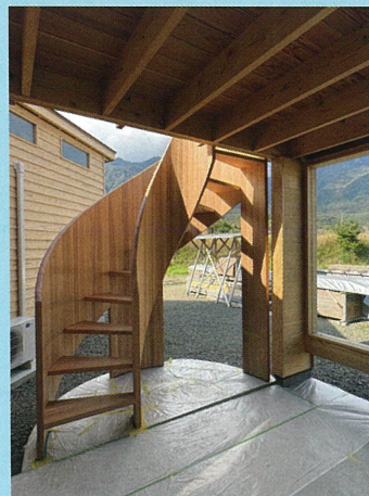
設計デザイン・施工：William Brouwer