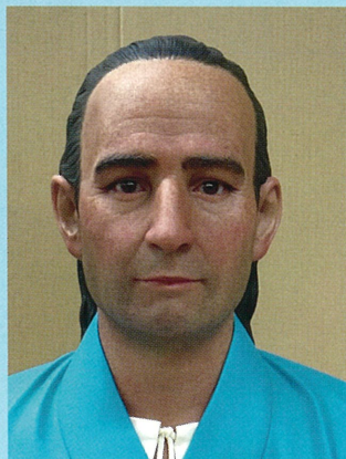
シドッティ復顔像（常設展示）